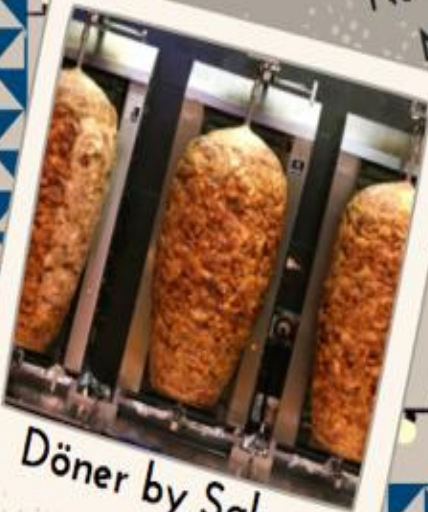
Döner by Sako