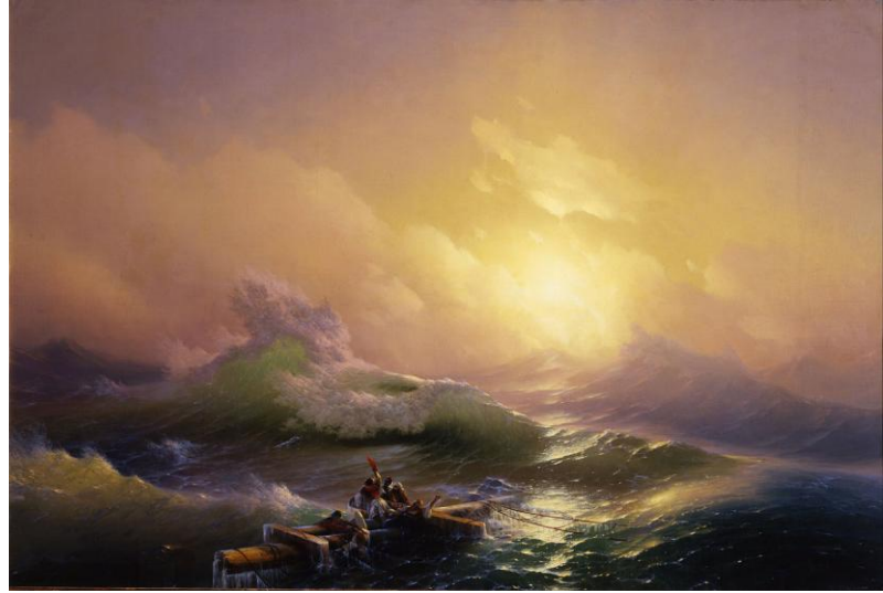
9-րդ ալիք: Յովհաննէս Այվազովսկի: 1850 թ.

Why it is common with Armenia and why it is well known is left to the reader. (SK / HK).