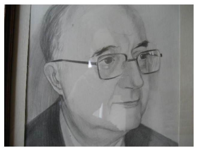
ՓՐՈՖ. ՕՇԻՆ ՔԷՇԻՇԵԱՆ

2արեհ Խրախունի, ժամանակակից հայ գրականութեան առաջատար կարեւոր դեմքերեն մեկը, մահացաւ Նոյեմբեր 27, 2015-ին Պոլսոյ մեջ` 89 տարեկանին։