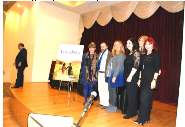
OIA HOSTED A RECEPTION FOR 2 CO WRITERS AND PRODUCERS OF "LOST BIRDS" FILM AT OIA CENTER